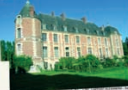
plan 35 extérieur jour

DEBUT DE SEMAINE 6 of Day 25 - lundi 27 mars 2008 - 10 pp