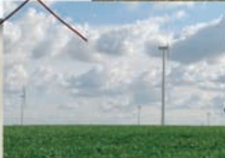
ext jour repérage technique le 4 mai