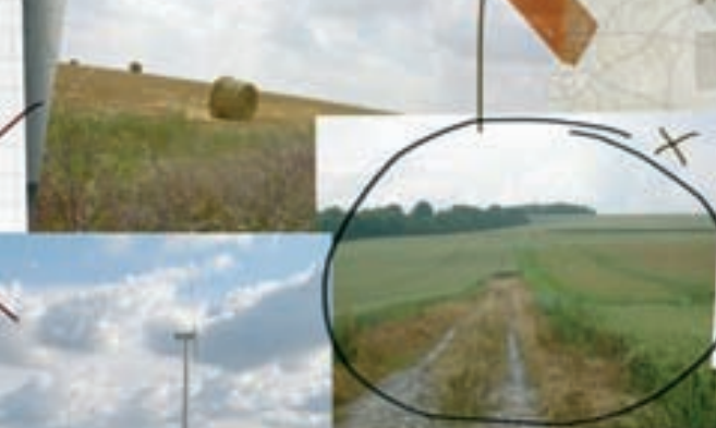
travaux pour plan 35 zone équipe jour ext. passage seq. 27