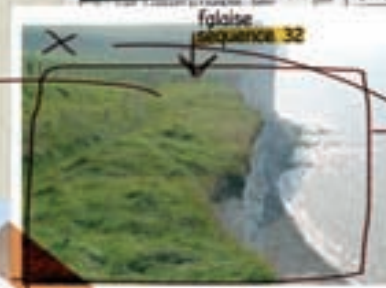
faloise séquence 32