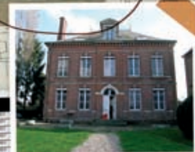
travaux de maître avant départ fin 2007 pour les 15 à 32

End of Day 60 - dimanche 30 avril 2008 - 12 pp